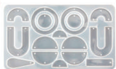
Stampo - Orecchini