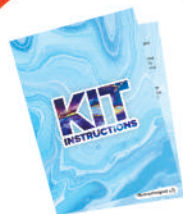
Guida passo passo