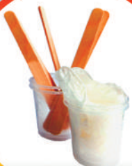
Guanti, strumenti per miscelare