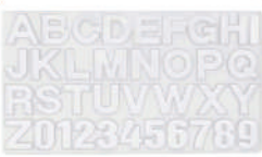
Stampo - Alfabeto